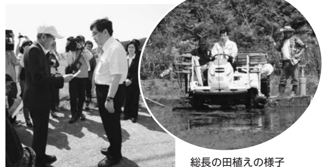
総長の田植えの様子

また、町長より引き続き東大生協における浪江産米の使用や浪江の農業再生に向けた東京大学の支援を要請しました。