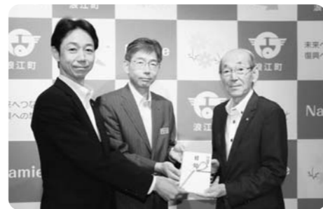
6月5日 東北電力福島支店様 東北電力福島県本部様 (LED街路灯50基)

ありがとうございます ご支援いただき ありがとうございました。 みなさまから義援金等を お届けいただきました。