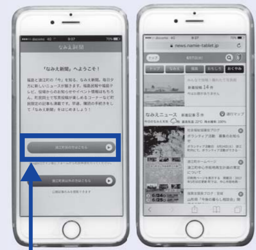
このボタンを押して、登録画面に進んでください。

【iPhone 対応 ウェブ版なみえ新聞】 https://news.namie-tablet.jp/