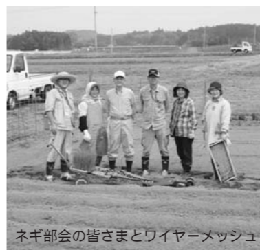
ネギ部会の皆さまとワイヤーメッシュ