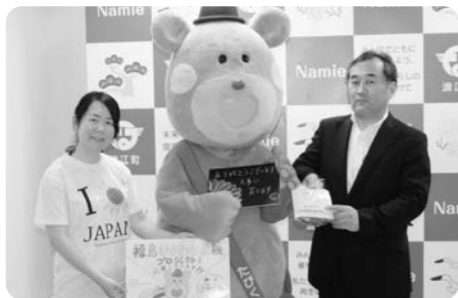
6月5日 福島ひまわり里親プロジェクト様(ひまわりの種)

ありがとうございます ご支援いただき ありがとうございました。 みなさまから義援金等を お届けいただきました。