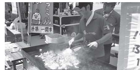
岩手県「いちのせきハラミ焼なじょったべ隊」による鳥のハラミ焼。ハラミとニンニクの芽、玉ねぎのバランスが絶妙であっという間に品切れとなってしまいました。