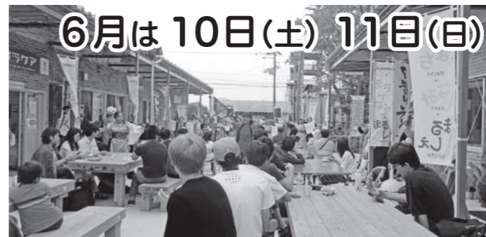
土曜日は突然の雷雨に見舞われましたが、2日間を通して夏のような暑さの中、約600名の皆さんにご来場いただき大盛況でした。