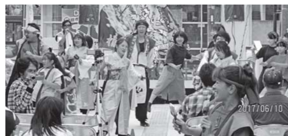
よさこい演舞(うつくしまYOSAKOI振興会)は、活気あるリズムに合わせて色とりどりの衣装を着た皆さんが元気いっぱい「よさこい」を披露しました。