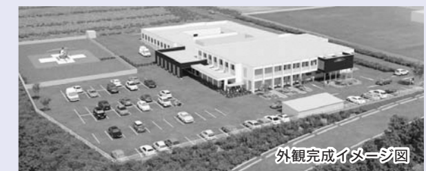
外観完成イメージ図