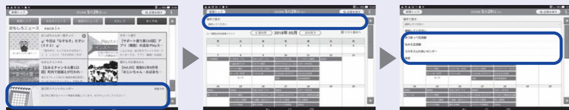
なみえ新聞の「おもしろ」から浪江町イベントカレンダーを押す

県内3か所にある交流館（福島、郡山、いわき）のイベント開催予定を、なみえ新聞から確認することができます。ぜひチェックしてみてください！