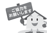
住宅・土地統計調査キャラクターハウス君