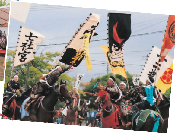
標葉郷 神旗争奪戦