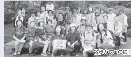
散歩カフェの様子