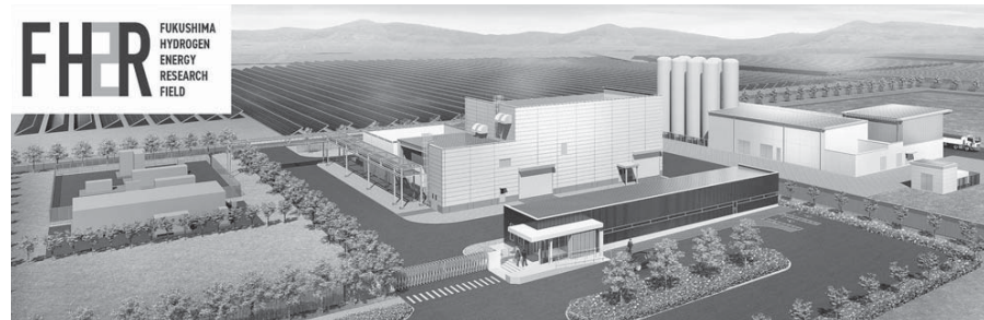
福島水素エネルギー研究フィールド完成イメージ図