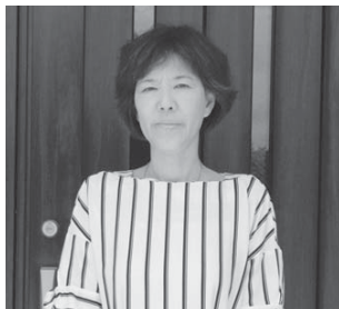
▲氏家さん ご自宅玄関前で

区の方には温かく迎え入れてもらい、焼肉会やカラオケ、バーベキュー大会等に誘っていただくなど、いつの間にか親しく飲み合う間柄になっていました。私たちがこうしてご恩に