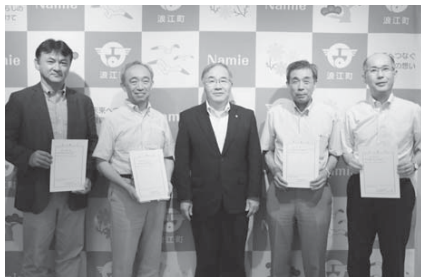
【浪江町除染検証委員会委員】 (敬称略)

第1回の委員会では、平成29年度浪江町除染結果報告、個別案件の検証を行いました。