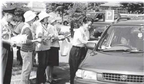
(29) 広報なみえ 2018.9.1

【連絡先】〒979-1592 双葉郡浪江町大字幾世橋字六反田7-2 「浪江のこころ通信」宛 FAX.0240(34)4593