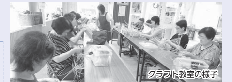
クラフト教室の様子