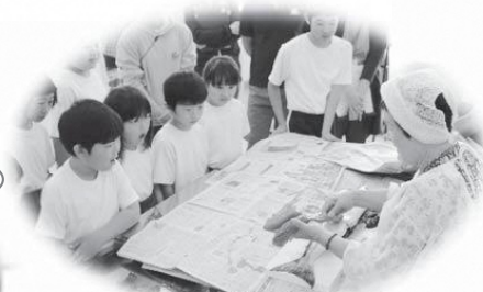
紅葉汁の作り方を教えてくださいました。その後地域の方と楽しく会食しました。