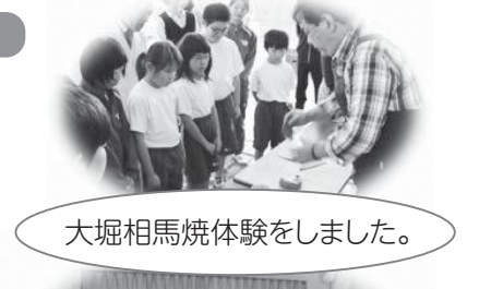
大堀相馬焼体験をしました。