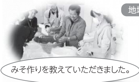
みそ作りを教えてくださいました。