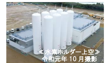
＜水素ホルダー上空＞ 令和元年 10月撮影