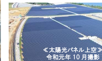
＜太陽光パネル上空＞ 令和元年 10月撮影