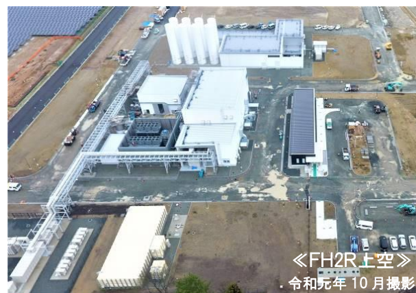
＜FH2R上空＞ 令和元年 10月撮影

水素エネルギー研究フィールド（FH2R）は、2019年9月で建屋内外の主要な工事が完了し、同年10月から試運転を開始しました。