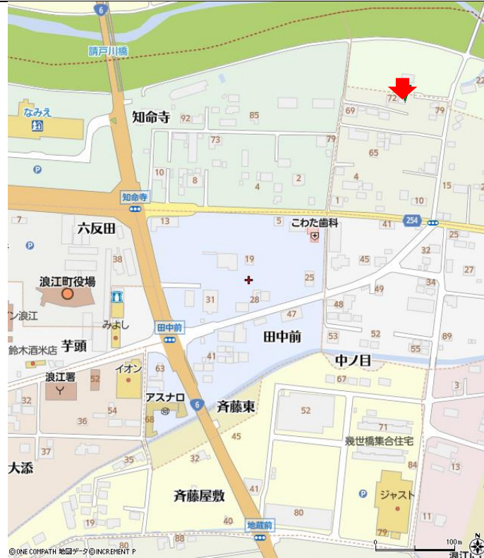
(11)配置図・間取り図・公図