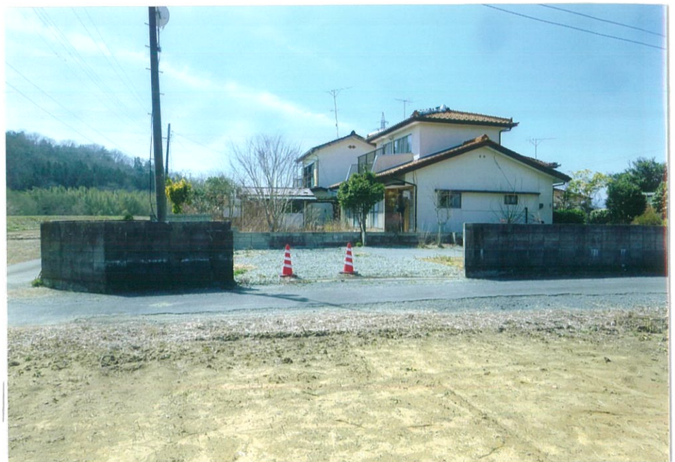
東方向より、ブロック内側