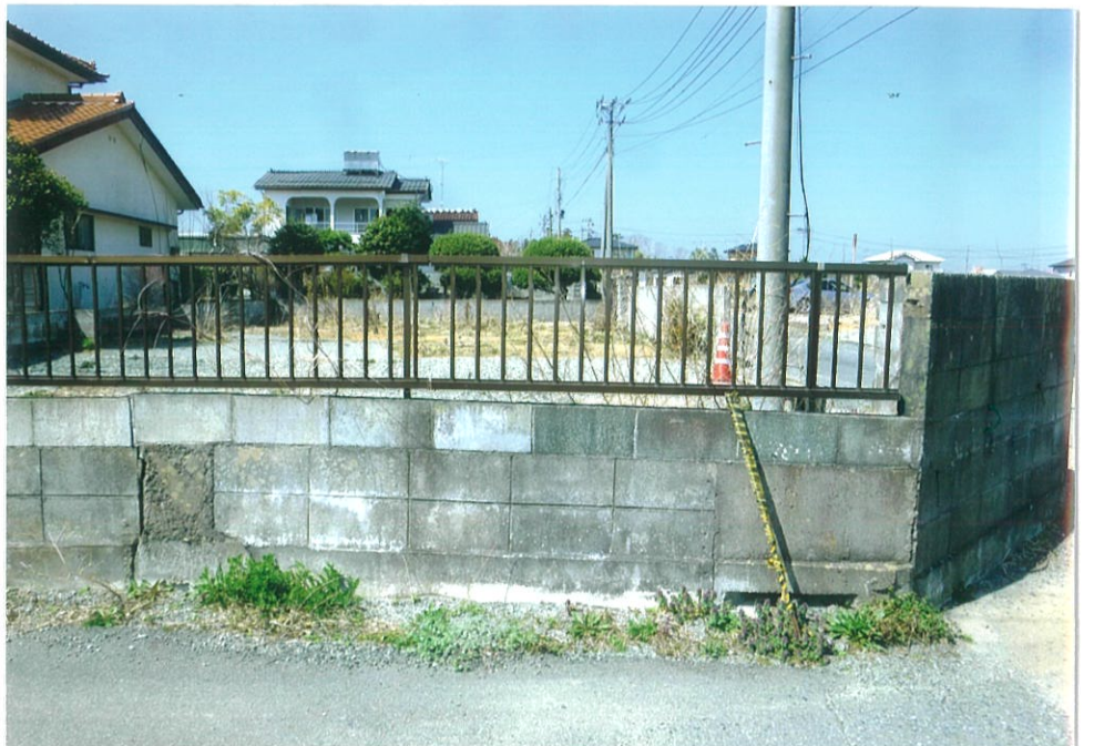
南方向より、ブロック内側