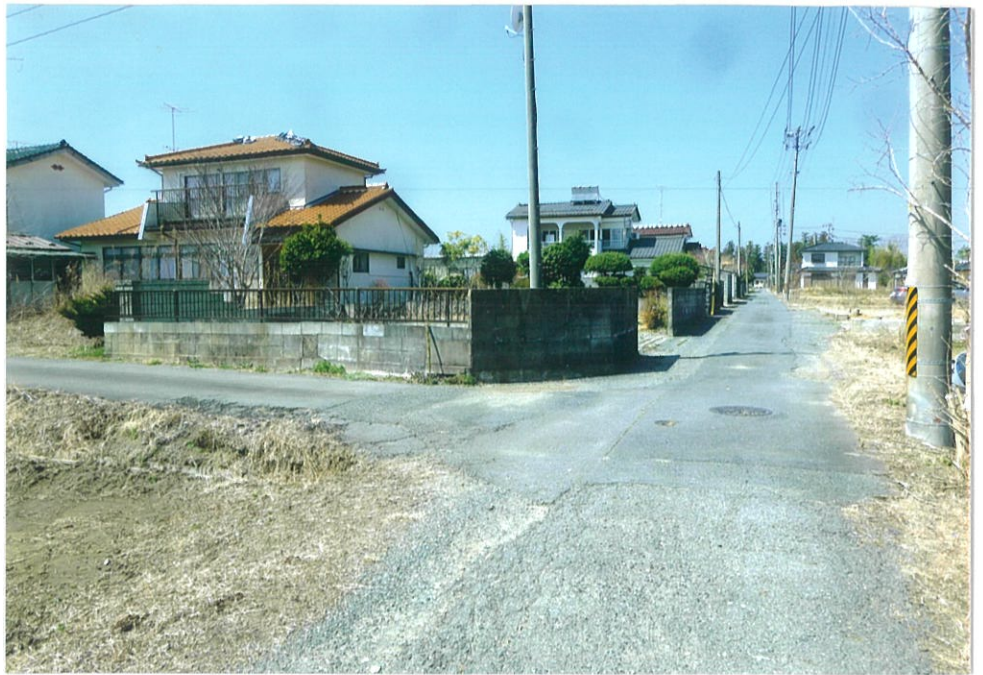
南方向より、ブロック内側